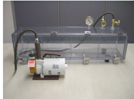
PVC - 91型 (横長型)